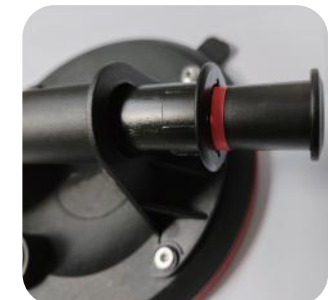
3. Nakonec vložte pístovou tlakovou pumpu do rukojeti.