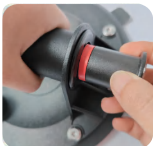
1. Pomalu vytáhněte píst tlakové pumpy a očistěte jej