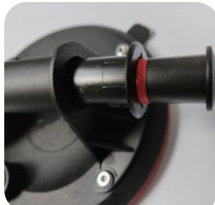
2. Po vyčištění pístu tlakové pumpy naneste mazivo