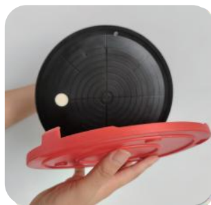
2. Zakryjte ochranným krytem