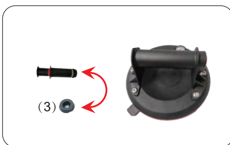
2. Uvolněte šroub z těla pístu, odstraňte podložku, vyměňte těsnící kroužek (3). Vložte podložku a zajistěte šroubem