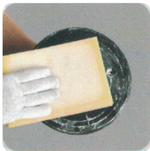
1. Očistěte povrch přísavky

Pozor: Produkt uchovávejte v čistém a suchém prostředí. Chraňte jej před nečistotami, aby nedošlo k poškození, či ovlivnění běžného používání.