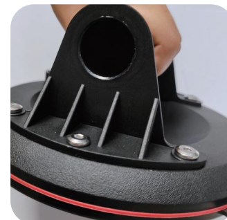
3. Vyčistěte tělo tlakové pumpy