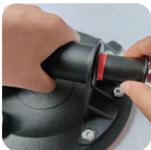
1. Pomalu vytáhněte píst tlakové pumpy